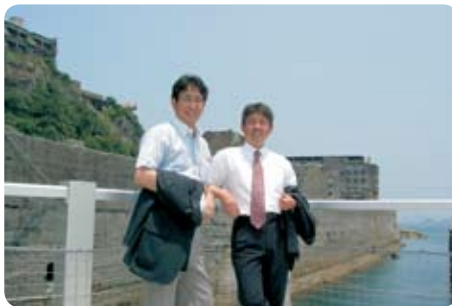
会派研修で長崎・軍艦島上陸