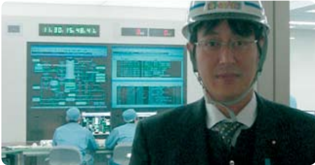
環境エネルギー議員連盟で仙台火力発電所を視察