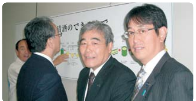
経済産業振興・国際戦略対策調査特別委員会県内視察で一の蔵本社視察