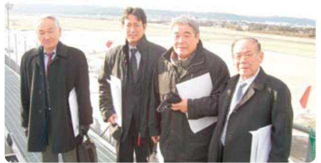
建設企業委員会で仙台空港新設展望デッキ工事現場視察

2月 ◎建設企業常任委員会で仙台空港鉄道の経営改善問題で本社にて状況聴取(名取市)