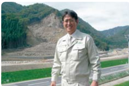
建設企業委員会県内視察で岩手宮城内陸地震災害箇所復旧現場視察