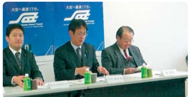
建設企業委員会で仙台空港アクセス鉄道経営改善策について概要聴取