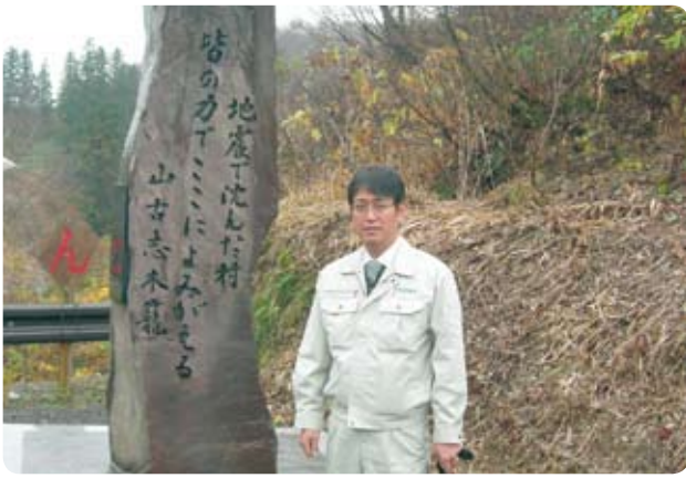
防災議員連盟幹事長として旧山古志村災害箇所現場視察