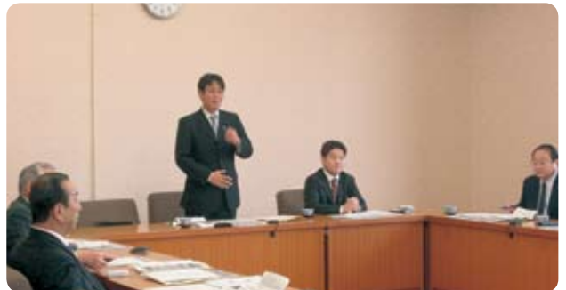
建設企業委員会県外視察で長崎振興局にて挨拶