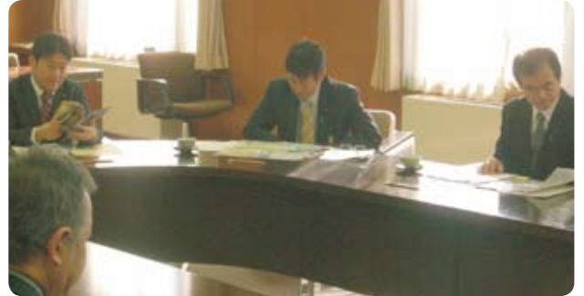
産業経済振興・国際戦略対策調査特別委員会県外視察で福岡県議会にて

1月 ◎産業経済振興・国際戦略対策調査特別委員会県外視察(福岡県議会, 熊本県議会, 福井県議会等)