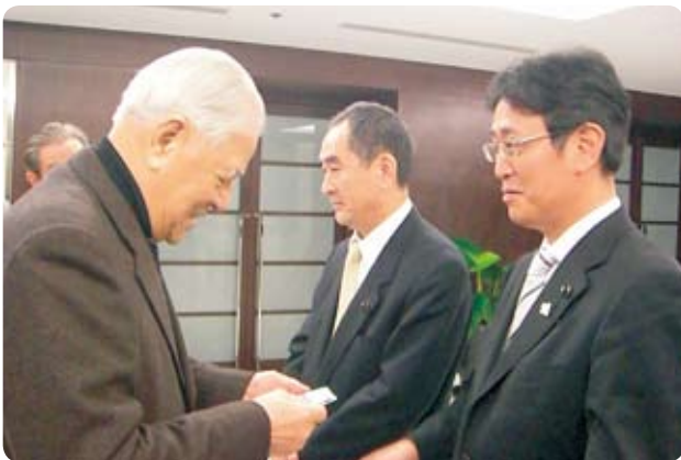
会派研修で台湾にて李登輝先生と懇談