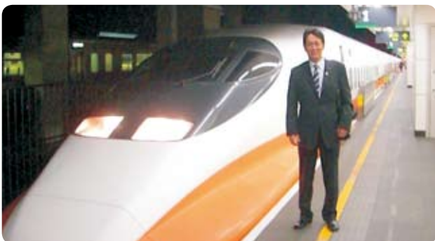
現地移動は台湾新幹線を利用しました